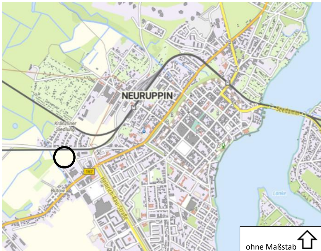
Abbildung 1: Räumliche Verortung im Stadtgebiet B-Plan Nr. 4.4 „Holländer Mühle West“ (ohne Maßstab); Kartengrundlage: Topographie/ Basiskarte, 2025; Quelle: © GeoBasis-DE/LGB, dl-de/by-2-0; © BKG (Daten geändert)

Die Lage und Abgrenzung des Plangebiets ist dem nachfolgenden Übersichtsplan zu entnehmen.