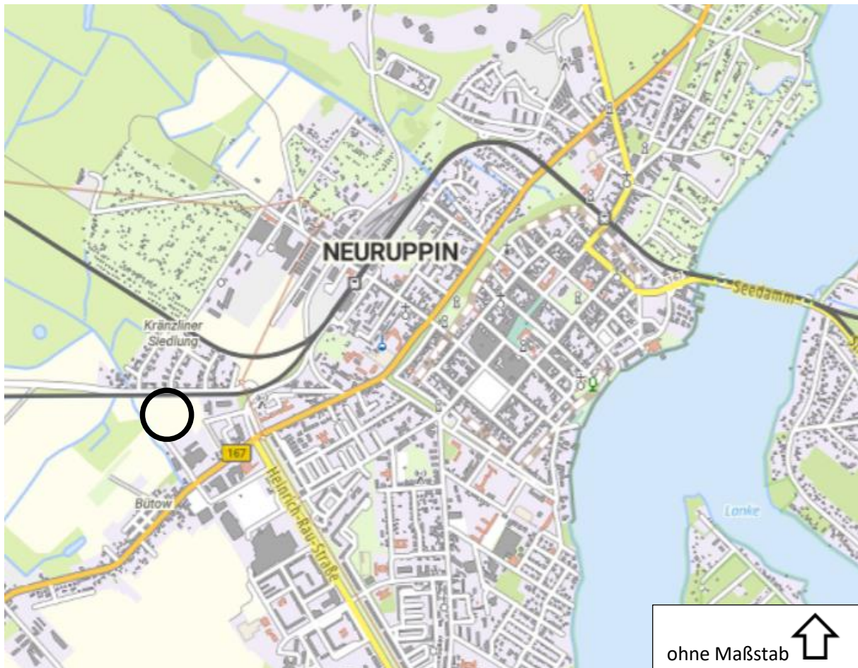
Übersichtskarte: Lage im großräumigen Stadtgebiet, Geltungsbereich 8. Änderung FNP, Teilbereich Holländer Mühle West, Kartengrundlage: Topographie/ Basiskarte, 2025; Quelle: © GeoBasis-DE/LGB, dl-de/by-2-0; © BKG (Daten geändert)