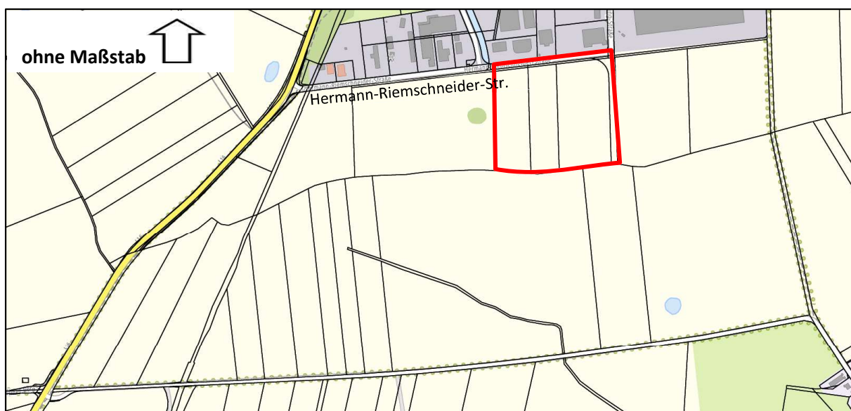
Abbildung 2: Geltungsbereich B-Plan Nr. 3.1 „Gewerbegebiet Treskow II“; Kartengrundlage: Topographie/ Basiskarte, 2025; Quelle: © GeoBasis-DE/LGB, dl-de/by-2-0; © BKG (Daten geändert)

Der Öffentlichkeit sowie den berührten Behörden und sonstigen Trägern öffentlicher Belange wird Gelegenheit zur Stellungnahme gegeben.