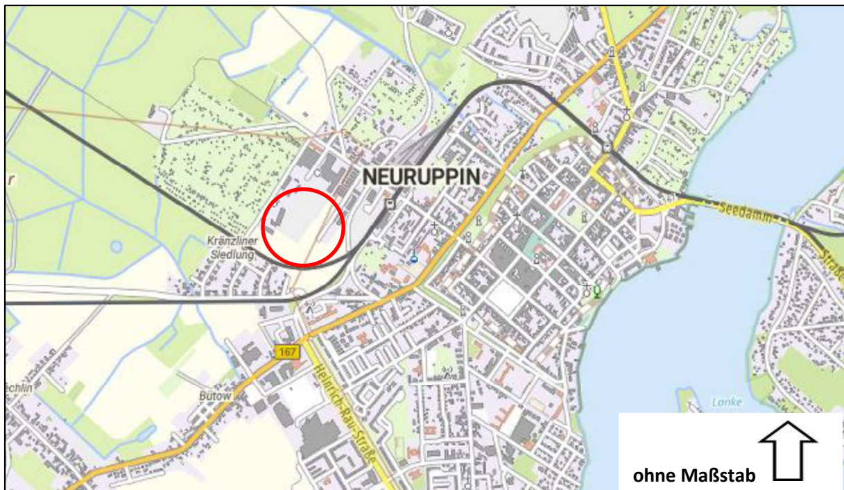
Abbildung 1: Räumliche Verortung im Stadtgebiet B-Plan Nr. 1.1 „Gewerbegebiet Zur Mesche“; Kartengrundlage: Topographie/ Basiskarte, 2025; Quelle: © GeoBasis-DE/LGB, dl-de/by-2-0; © BKG (Daten geändert)

Die Lage und Abgrenzung des Plangebiets ist den nachfolgenden Abbildungen zu entnehmen.