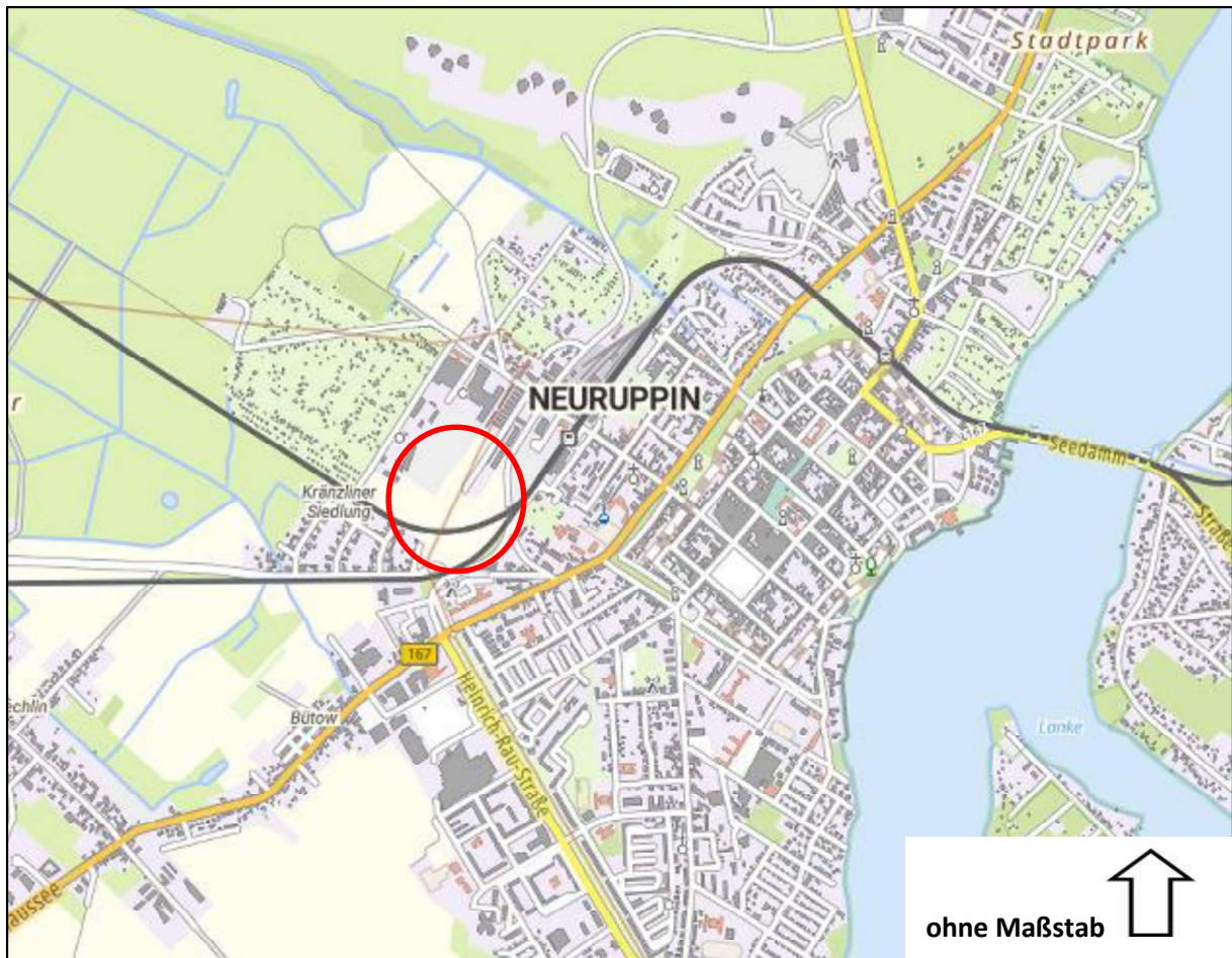
Abbildung 1: Räumliche Verortung im Stadtgebiet 7. Änderung des FNP für den Teilbereich „Zur Mesche“; Kartengrundlage: Topographie/ Basiskarte, 2025; Quelle: © GeoBasis-DE/LGB, dl-de/by-2-0; © BKG (Daten geändert)